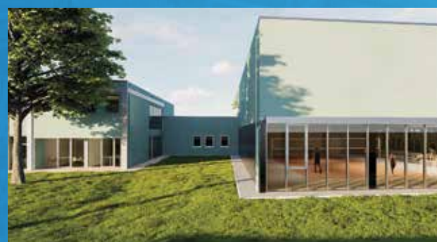
Progetto esecutivo nuova Galilei: 1° ciclo primaria (Seggiano)