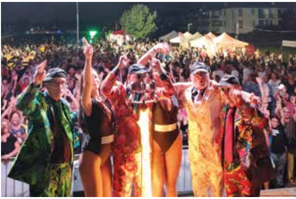
La festa cittadina richiama sempre centinaia di persone: lo spettacolo degli Alt@moda ha chiuso l'edizione 2025 con un grande successo di pubblico

comfort anche in caso di maltempo. Parola d'ordine, partecipazione! Saranno infatti coinvolte tante realtà del territorio: associazioni culturali, di volontariato, sportive, oratori, scuole e commercianti. Tutte le sere, a partire dalle 21, sono in programma musica dal vivo e spettacoli : dalla musica revival anni '70-'80-'90 alle serate di li-