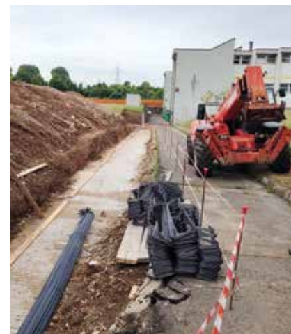
Realizzazione ingresso nuova scuola primaria 2° ciclo Istituto Iqbal Masih (Seggiano)