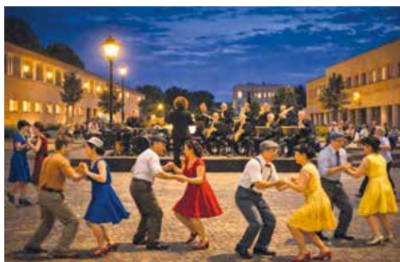
Una simulazione Al trasforma Piazza Don Milani a Limito in una pista da ballo per la Festa della Musica

Si comincia domenica 21 giugno, primo giorno d'estate, quando Piazza Don Milani a Limito, dalle 21, si trasformerà in una grande pista da ballo sotto le stelle per celebrare la Festa della Musica con la Madamzajj Swinging Band che accompagnerà il pubblico in un viaggio tra i grandi classici americani e le canzoni italiane che hanno fatto ballare generazioni, da "Cheek to Cheek" a "Moonlight Serenade", da "New York, New York" a "Buonasera Signorina" e "Mambo Italiano". Una serata aperta a tutta la cittadinanza per inaugurare insieme l'estate con l'energia travolgente e coinvolgente della musica.