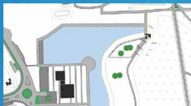
Nuove aree cani Residenze Malaspina