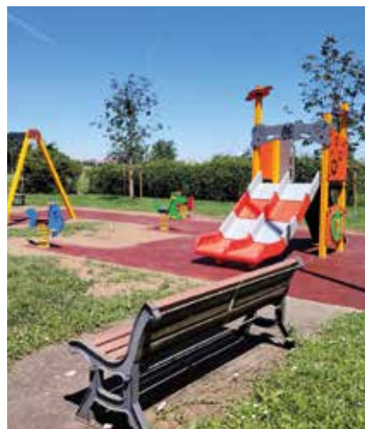
Nuovo parco giochi nel quartiere Rugacesio