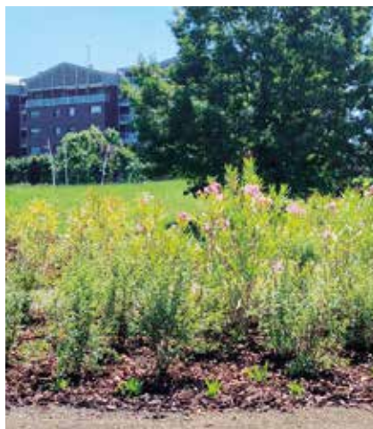
Fiori e piante nella ex fontana davanti al Polo sanitario Don Franco Maggioni