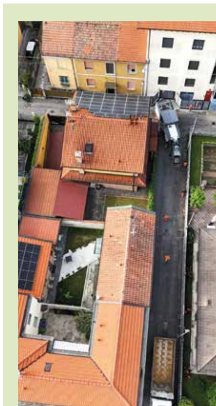
Via Alfieri dall'alto: interventi di asfaltatura per una viabilità più sicura e scorrevole

Rifacimento dei cappotti termici in tutte le scuole della città. Nelle immagini: la primaria di via Bizet, la secondaria Di Vittorio e l'infanzia di via Signorelli. Sono in corso gli interventi alla primaria di via Togliatti e al nido di Seggiano. A seguire, i lavori interesseranno le scuole dell'infanzia di via Tobagi e via Palermo, il Palazzetto dello Sport di Limoto e la palestra di via Molise